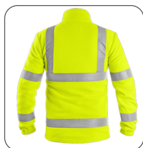
zadní strana back side z tyłu