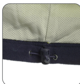
stažení v dolní části tightening at the bottom ściągacz w dolnej części