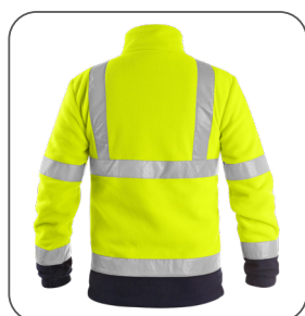
zadní strana back side z tyłu